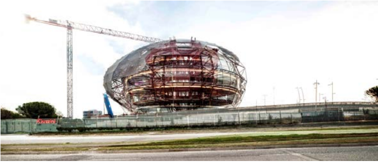
Fotografia Raigs X de la sede iGuzzini Illuminazione Iberica. Autor: Adrià Goula