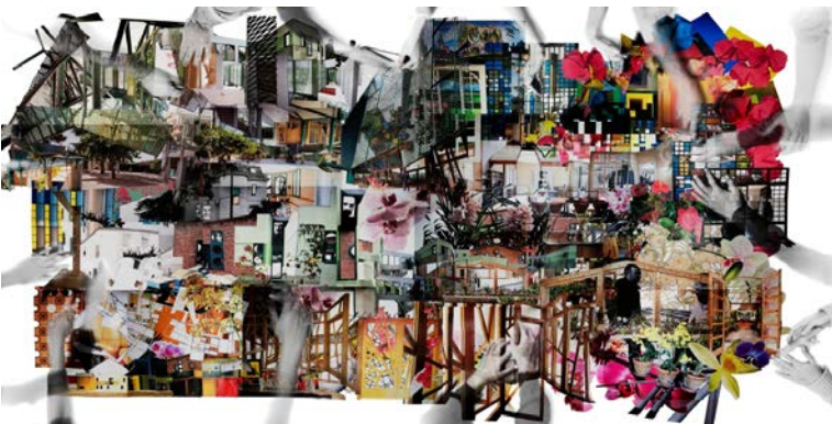
Collage de la Clínica de Salut Mental Can Zariquiey. Autor: MIAS Architects