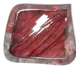
Penjoll. Joies de sorra , 2006. Plata i pintura acrílica