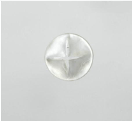
Penjoll. Escuts , 2011. Plata

que incorporen pintura. Aquestes obres donen forma a la vida en moviment a través del gest i materialitzen la capacitat del buit per donar forma a l'espai. Parlem de peces en què l'embat directe de l'artista genera un espai sempre diferent en la matèria i com el color il·lumina la seva qualitat física.