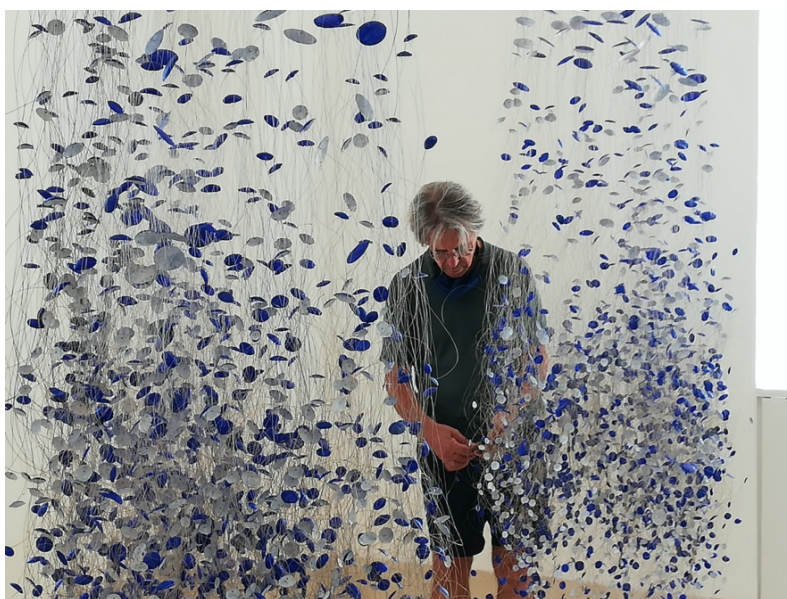
L'aiguador (detall), 2019 – 2020). Plata i pintura acrílica

Tanca l'exposició L'Aiguador (2019 -2020), una escultura ingràvida que baixa del sostre com un planeta estrellat. Aquesta joia monumental es presenta com un dibuix a l'espai fet d'estructures de plata pintada que es multipliquen des d'un centre obert. L'Aiguador transmet la coexistència de forma i llum; de moviment i espai; floració de metall i color.