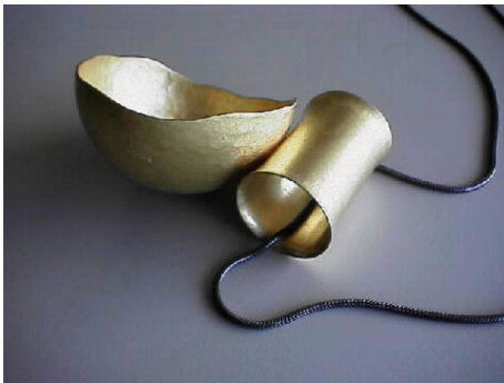
Penjoll. Cuconet , 1998. Or