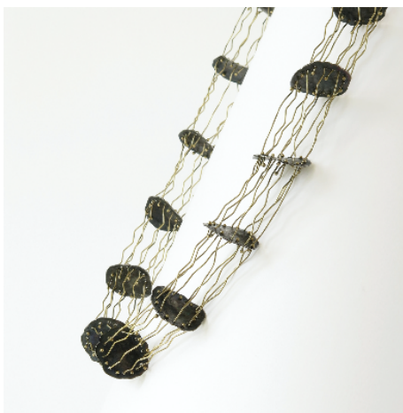
Collaret Aigua , 2002. Plata i or