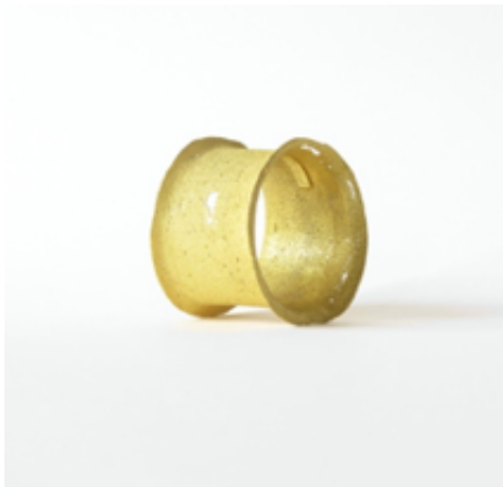
Braçalet. Joies de sorra , 2007. Or