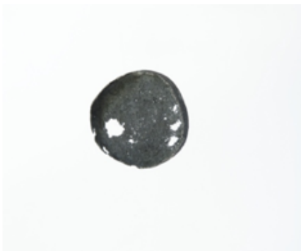
Fermall. Joies de sorra , 2007. Plata pavonada

Les Joies de sorra sorgeixen de l'ús innovador del poliuretà , molt popular entre els escultors i amb una textura de gran riquesa. Aquest material s'activa amb l'aplicació posterior del pigment que, en diàleg amb els processos d'oxidació propis de la plata, desencadena una gamma de colors i metamorfosis del material impensables. En lloc de crear una joia, Enric Majoral l'esculpeix, la pinta i deixa que l'atzar la transformi. Aquestes obres demostren com, més interessat en el funcionament dels materials que en la simple tècnica, Majoral arriba a la maduresa de l'ofici abandonant tot mètode i lliurat a la bellesa de la improvisació i la imperfeció . Hi trobem penjolls (2006), fermalls (2007), braçalets (2006 i 2007) i anells (2006). Totes les peces combinen plata, or i pintura.