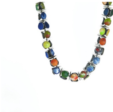
Collaret. Cuconets , 2006. Plata i pintura acrílica