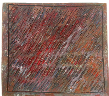
Penjoll, 2008. Plata oxidada, textura i pintura