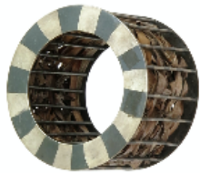
Braçalet de plata. Mar de Formentera, (Gabieta) 1998. Plata i posidònies naturals

se situa al marge dels codis i les maneres de fer de l'alta joieria en el seu sentit tradicional, i demostra com l'eloqüència muda de la pintura no silencia la densitat i l'energia del metall ocult. Altres obres d'aquest àmbit són els penjolls Universos (2000), el collaret Aigua (2002) i el penjoll Nius (2008).