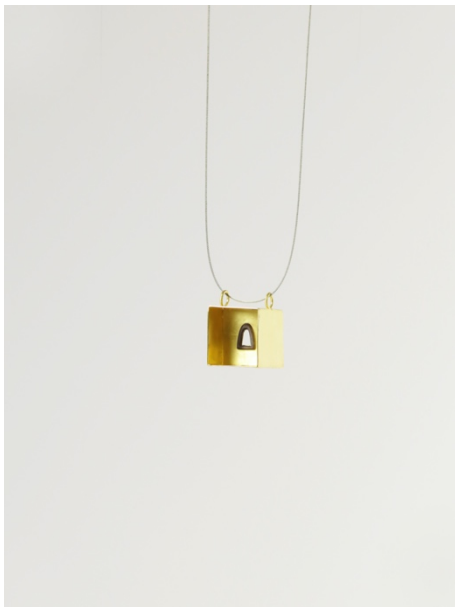
Penjoll. Capelleta , 1996. Or i pintura acrílica