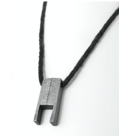
Penjoll Blocs , 2012. Plata i llana mohair