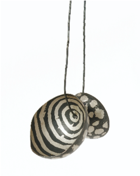
Penjoll Batik , 2006. Plata i tècnica bàtik