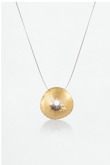
Penjoll. Tresor , 2008. Or

L'àmbit que tanca l'exposició fa referència al procés en què sorgeixen els noms que identifiquen les col·leccions de Majoral . Es tracta d'un procediment compartit en el qual, una vegada finalitzada la joia, tot l'equip en palpa les seves estructures i materials, en pren la temperatura, la densitat o la lleugeresa dels seus materials, la sospesa, l'escolta, n'observa els seus colors i textures, els moviments a l'espai i el seu comportament damunt del cos. D'aquest procés van sorgint cadascun dels noms que identifiquen les col·leccions de Majoral. Uns noms que convoquen un mapa de sabers antics, que emanen de saber llegir les formes del vent, el moviment de les aus, els sons de la matèria i la reverberació de la llum. Per això, en aquesta secció hi trobem obres com el penjoll Tresor (2008), els collarets Vida (2013), Aire (2013), Núvols (2016) i Baladre (2012) i el collaret Bots (2016) i Olives (2010), entre d'altres.