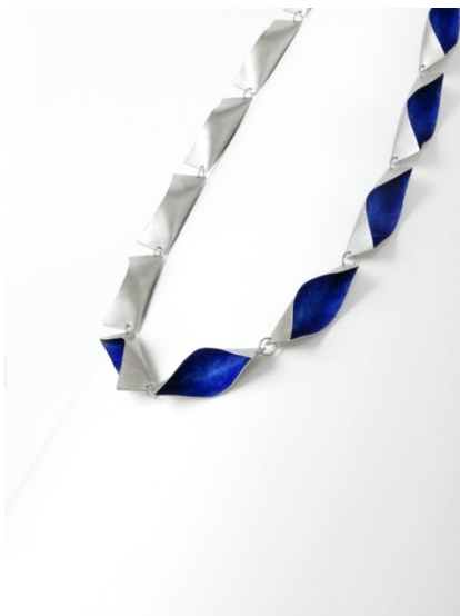
Collaret. Bots , 2016. Plata i pintura acrílica