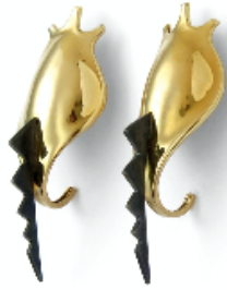
Arracades. Drac , 1992. Plata i or