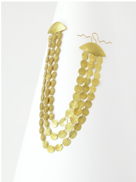
Collaret. Incisions , 1993. Or