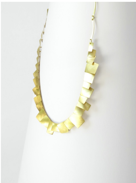
Collaret. Aire , 2013. Or