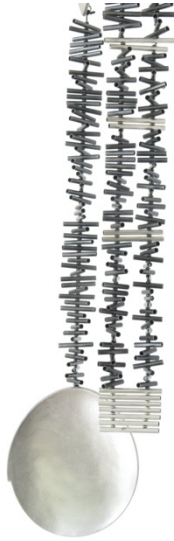
Collaret. Eivissa , 2010. Plata