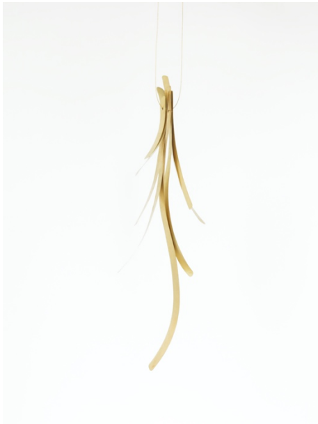
Penjoll. Posidònia , 2019. Or