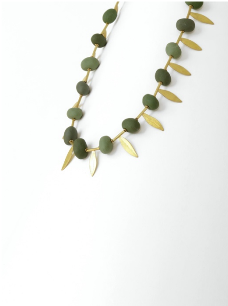
Collaret. Olives , 2010. Or i porcellana