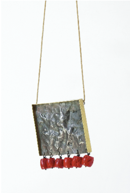
Penjoll Àfrica , 2001. Plata, or i corall