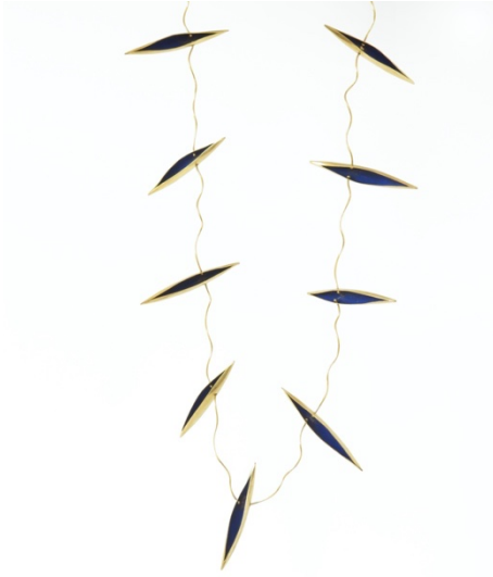
Collaret. Interiors , 1997. Or i pintura acrílica