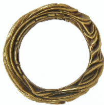
Braçalet, 1979. Bronze

El primer àmbit de la mostra està dedicat a conèixer els orígens vitals i creatius d'una figura que, a partir de la curiositat, l'experimentació i les maneres de fer artesanals es va convertir en un joier fet a sí mateix en el bressol de la cultura mediterrània i el lligam amb el territori. En aquests inicis, els valors ancestrals i els usos socials de la joia sustenten el treball de Majoral, i l' or i la plata , materials nobles de gran sentit simbòlic i espiritual, configuren les seves creacions. En aquest àmbit s'hi poden veure una sèrie de collarets, arracades, anells, penjolls i braçalets que reflecteixen de quina manera explorar la capacitat expressiva de la tècnica i de la matèria és una constant en l'itinerari creatiu d'Enric Majoral. Destaquen obres com el Braçalet de bronze (1979), el fermall i collaret Sargantanes (1983), les arracades Drac (1992), el collaret i anell Rocs (1990) i el collaret Incisions (1993).