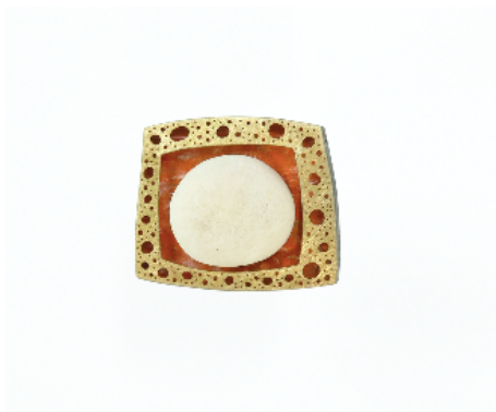
Penjoll de plata, or, pintura i bola de corall blanc, 2000. Plata, or, pintura i corall blanc