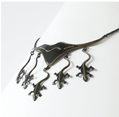
Collaret. Sargantanes , 1983. Plata i or