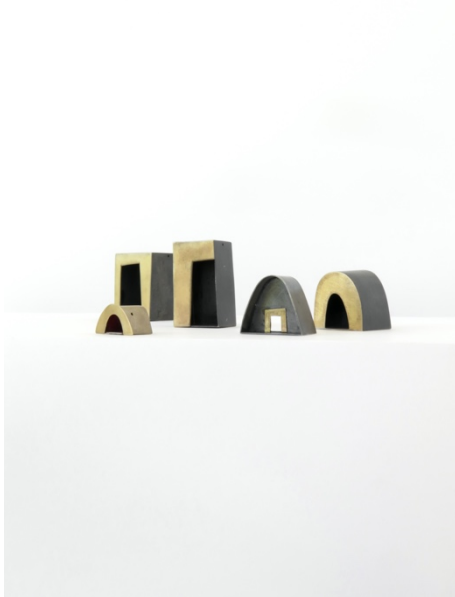
Penjolls. Capelletes , 1996 – 1997. Plata i or