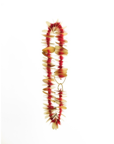
Collaret. Moher , 2003. Or i llana moher