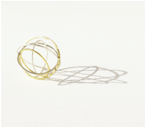
Penjoll Universos , 2000. Or i plata