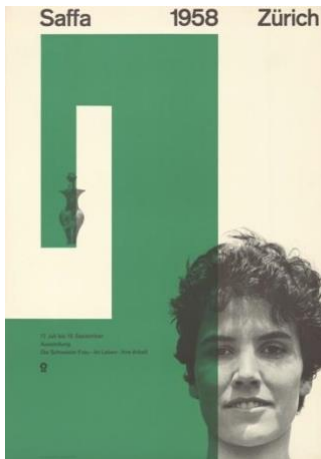
Cartell de la Schweizerische Ausstellung für Frauenarbeit (Swiss Exhibition for Women's Work), SAFFA, Zurich, 1958, dissenyat per Nelly Rudin Plakatsammlung Schule für Gestaltung Basel, Copyright for Nelly Rudin: © VGBild-Kunst