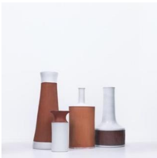
Hedwig Bollhagen, Vasos. Peces individuals i de mostra, dècada dels 1950 i 1960.