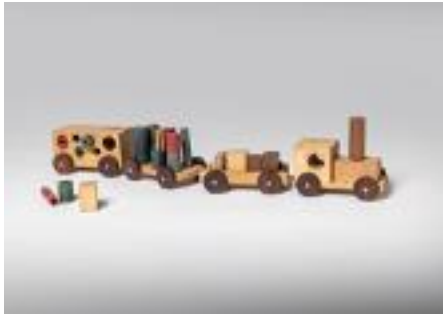
Fina Rifà i Anton Font Joguina Carrilet c. 1968 Producció Didó, Barcelona Fusta natural i tintada 12 x 14 x 8,5 cm cada vagó Donació família Bonet Peitx