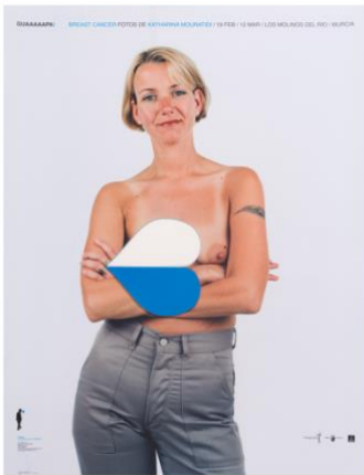
Cartells GUAAAAAPA! 2009 Germinal Comunicación (Disseny i direcció creativa: Jorge Martínez) Barcelona Paper 65,1 × 49,5 cm Donació ADG - FAD, 2016 MDB 913-916