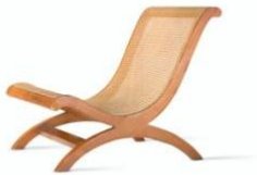
Clara Porset, Butaque, 1948