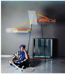
Nanda Vigo 1985 amb els seus dissenys: Light Tree (1984) and Cronotopo (1964).