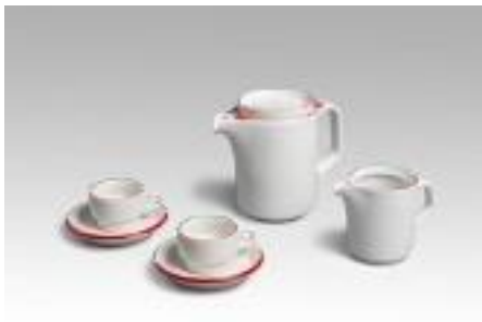
Margarita Sala Gaschen Joc de cafè , 1982 Producció bedre, La Roca del Vallès Porcellana Donació Margarita Sala, 2023 MDB 16.371