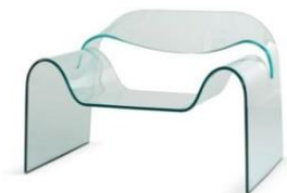
Cini Boeri, Tomu Katayanagi Ghost, 1987