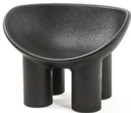
Faye Toogood, Roly Poly, 2018 © Vitra Design Museum, foto: Andreas Sütterlin