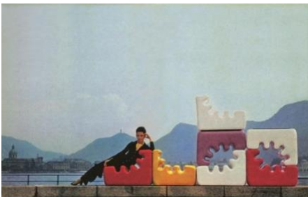
Anunci de la butaca Karelia, de Liisi Beckmann, 1969

Per altra banda, es remarca el paper de dues empresàries claus per a l'expansió del disseny a l'època a una i altra banda de l'Atlàntic. Des de les seves empreses, Maddalena de Padova i Florence Knoll van contribuir a consolidar els noms d'arquitectes i dissenyadors com ara Ludwig Mies van der Rohe, Harry Bertoia o Achille Castiglioni entre el públic. També s'analitza el cas d'Armi Ratia, cofundadora de Marimekko, una companyia tèxtil finlandesa que va marcar una època gràcies als seus estampats alegres i colorits.