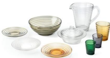
Aino Aalto, Bølgeblikk glas series, 1932