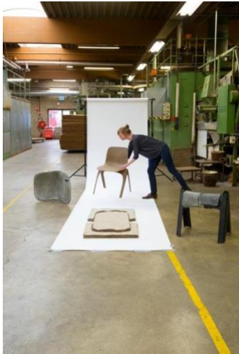
Christien Meindertsma amb la cadira Flax, 2015