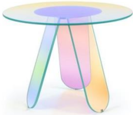
Patricia Urquiola, Shimmer, 2019