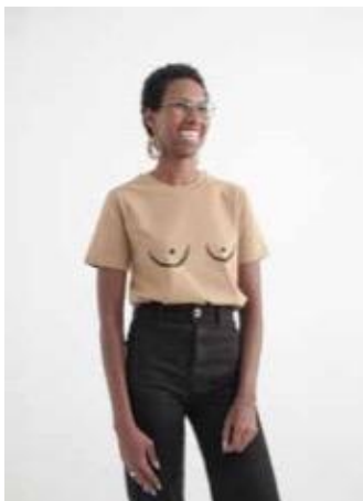
Samarreta Nudista 2015 teta & teta Producció teta & teta, la Coruña Gènere de punt de cotó pintat a mà Donació teta & teta, 2023 MDB FALTA