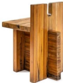
Lina Bo Bardi, tamboret per al Centre SESC Pompeia, São Paulo, 1979/80