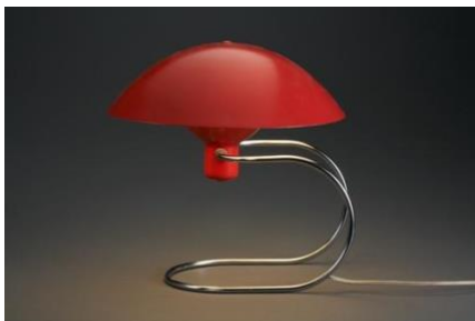
Greta von Nessen, llum de taula Anywhere, 1952, © Vitra Design Museum, foto: Andreas Jung