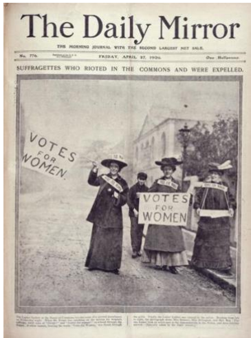
Article de premsa sobre una protesta sufragista a la Cambra dels Comuns, a: The Daily Mirror, Londres, 27 d'abril de 1906

Per últim, el primer àmbit de l'exposició reconeix la feina de les dones que van treballar en escoles i tallers com la Wiener Werkstätte o el Deutsche Werkstätten Hellerau de Dresde, que defensaven la reforma social i el disseny com eines per contrarestar l'acceleració de la industrialització, criticaven la producció massiva d'articles de qualitat inferior i proposaven la unió de les arts i els oficis per produir objectes bells i ben fets.