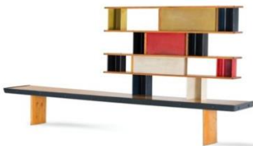
Charlotte Perriand, Untitled / Bibliothèque Tunisie, 1952