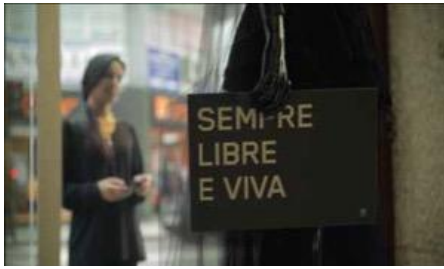
Campanya En Negro Contra as Violencias 2015-actualitat Uqui Permui Donació Uqui Permui, 2023 MDB