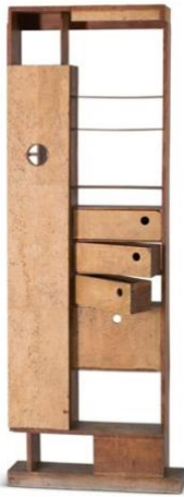
Eileen Gray, Untitled / Dressing cabinet for the Tempe a Pailla house, 1932-34