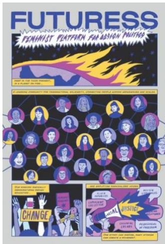
Il·lustració de la Plataforma feminista Futuress, 2021, © Maria Júlia Rêgo