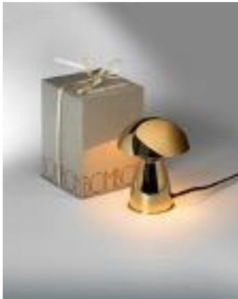
Nancy Robbins Llum de taula Bombon , 1988 Producció Vapor, Barcelona Planxa de metall 14,5 x 10,5 diàm. cm Donació Nancy Robbins, 2022 MDB 15.424