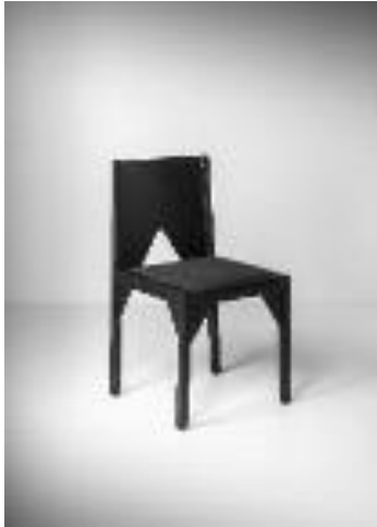
Lola Castelló Cadeira Nit , 1986 Producció Punt Mobles, SL, València Estructura de fusta lacada a porus obert i tapisseria d'Alcàntara 80 x 45,5 x 49 cm Donació Lola Castelló, 2023 MDB 16.378