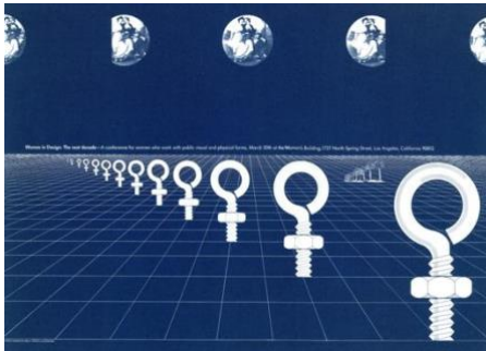
Sheila Levrant de Bretteville, Women in Design – The Next Decade, 1975, © Sheila Levrant de Bretteville