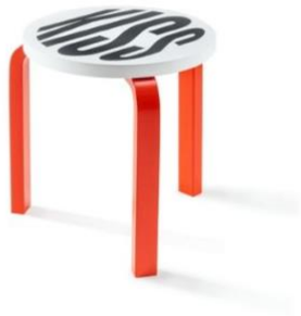
Barbara Kruger, Untitled (Kiss), Tamboret 60, 2019 (Design Alvar Aalto) © Vitra Design Museum, foto: Andreas Sütterlin, © VG Bild-Kunst, Bonn 2021