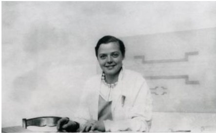
Charlotte Perriand, ca. 1929, imatge de projecció