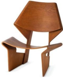
Grete Jalk, No. 9-1 / GJ Chair, 1963