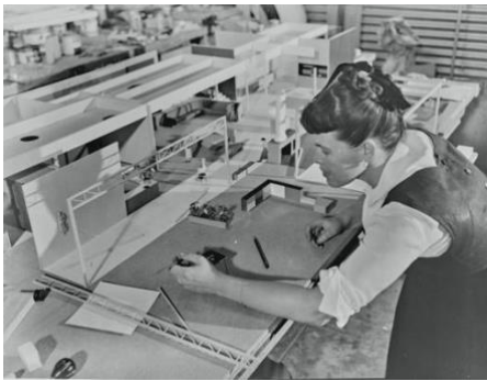
Ray Eames treballant a una maqueta, 1950, imatge de projecció, © Eames Office LLC