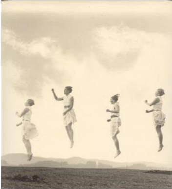
Loheland photo workshop: Jump (Montage), c. 1930