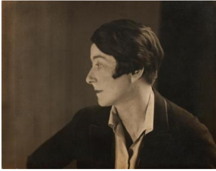
Berenice Abbott, retrat d'Eileen Gray, 1927, imatge de projecció © National Museum of Ireland