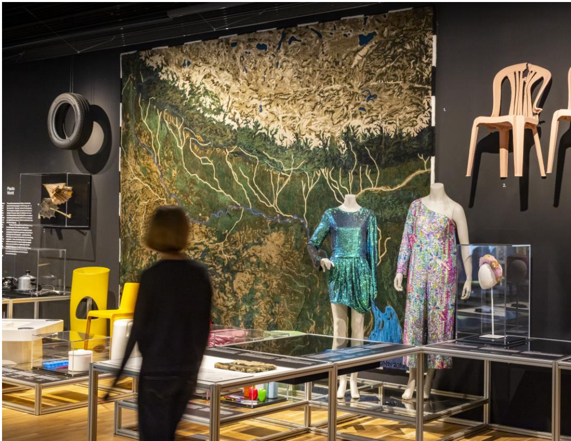
Matèria petroquímica

3) Vestit Wicked hope, Vestit de gasa de seda brodada amb lluentons de plàstic i botons de pell xarolada trenada Ángel Vilda, Barcelona, 2005. Donació Ángel Vilda, 2014 MTIB 4.172/14