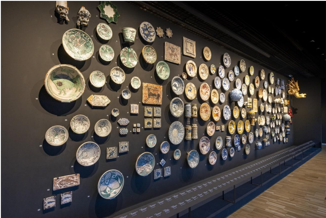
Natura Morta

Formalització: La instal·lació és un "paisatge de paisatges" situada en paral·lel al balcó lineal amb vistes a la ciutat de 20 metres.