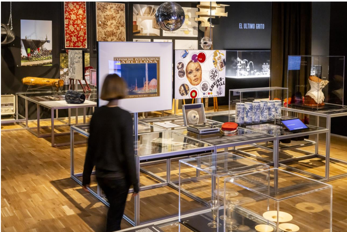
Matèria intangible (Foto: Gunnar Knechtel)

3) Matèria intraconnectada Imatge termogràfica de l'edifici DHub Barcelona, octubre de 2024 Droneit / Olga Subirós