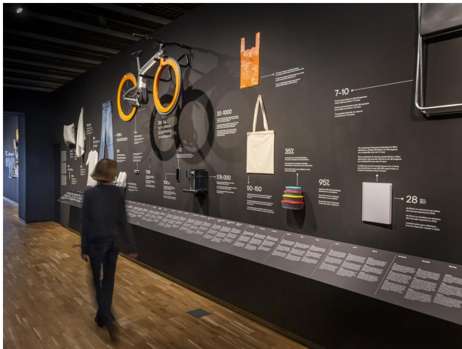
Matèria Situada

Formalització: Disposició lineal d'objectes acompanyats de textos i dades.