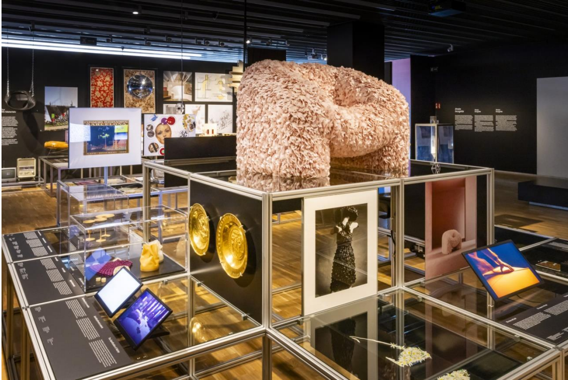
Matèria digital