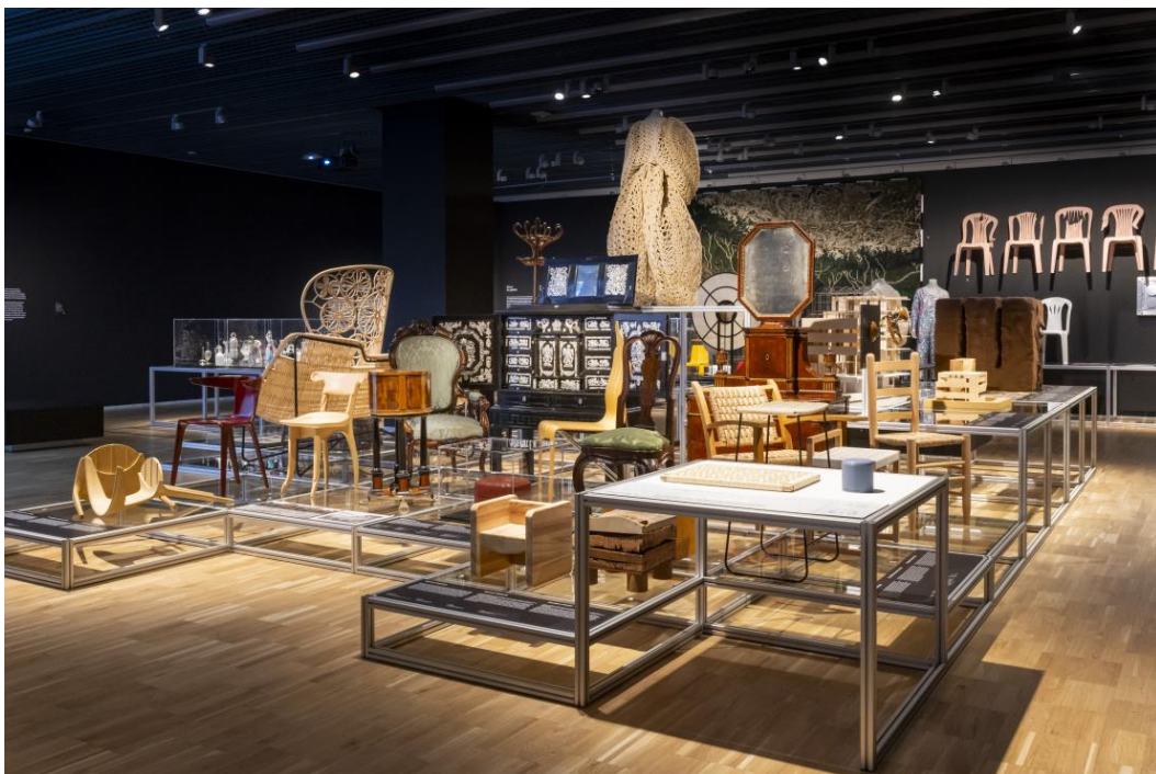
Matèria vegetal

4) The Transspecies Cork. Prototip de bio-façana. Desgranat d'escorça de Quercus suber i bio-polímers naturals projectat Andrés Jaque / Office for Political Innovation i VIPEQ, Madrid, 2020 Préstec Andrés Jaque/Office for Political Innovation