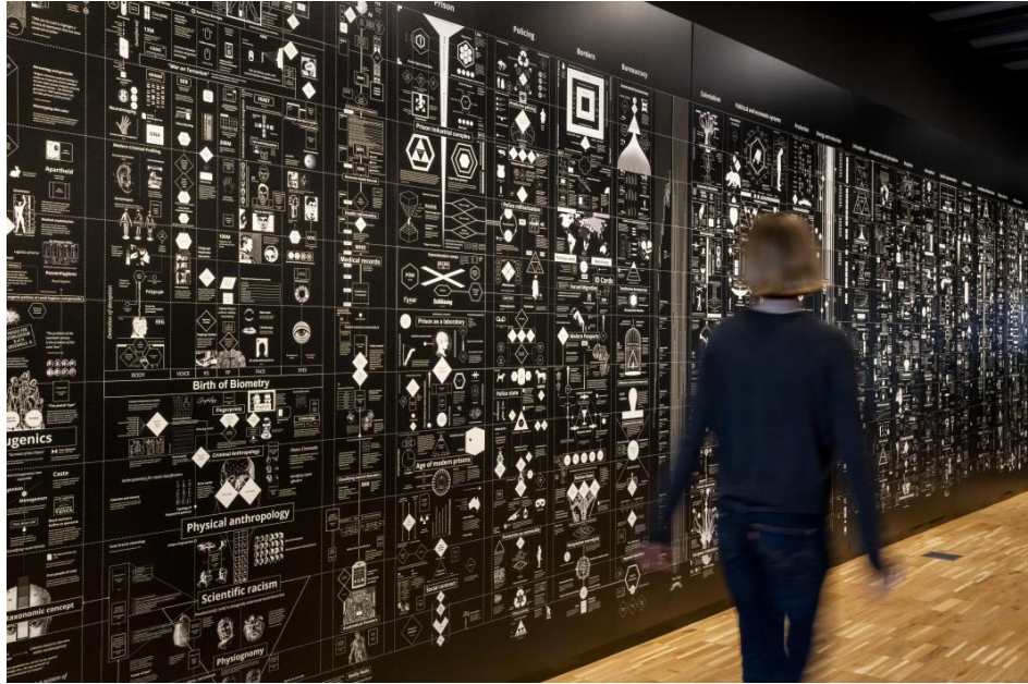
Calculating Empires