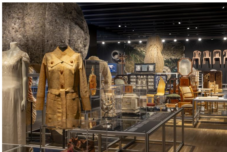
Matèria animal