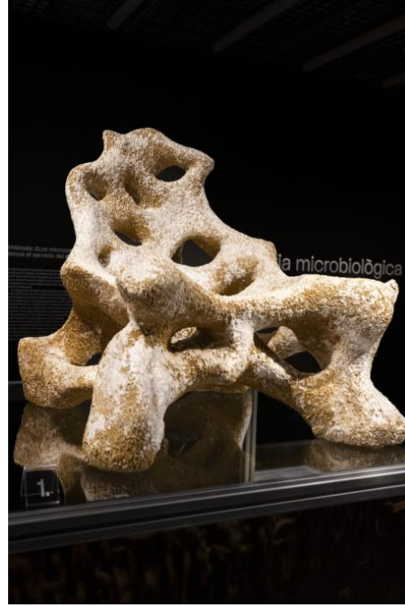
Matèria microbiològica