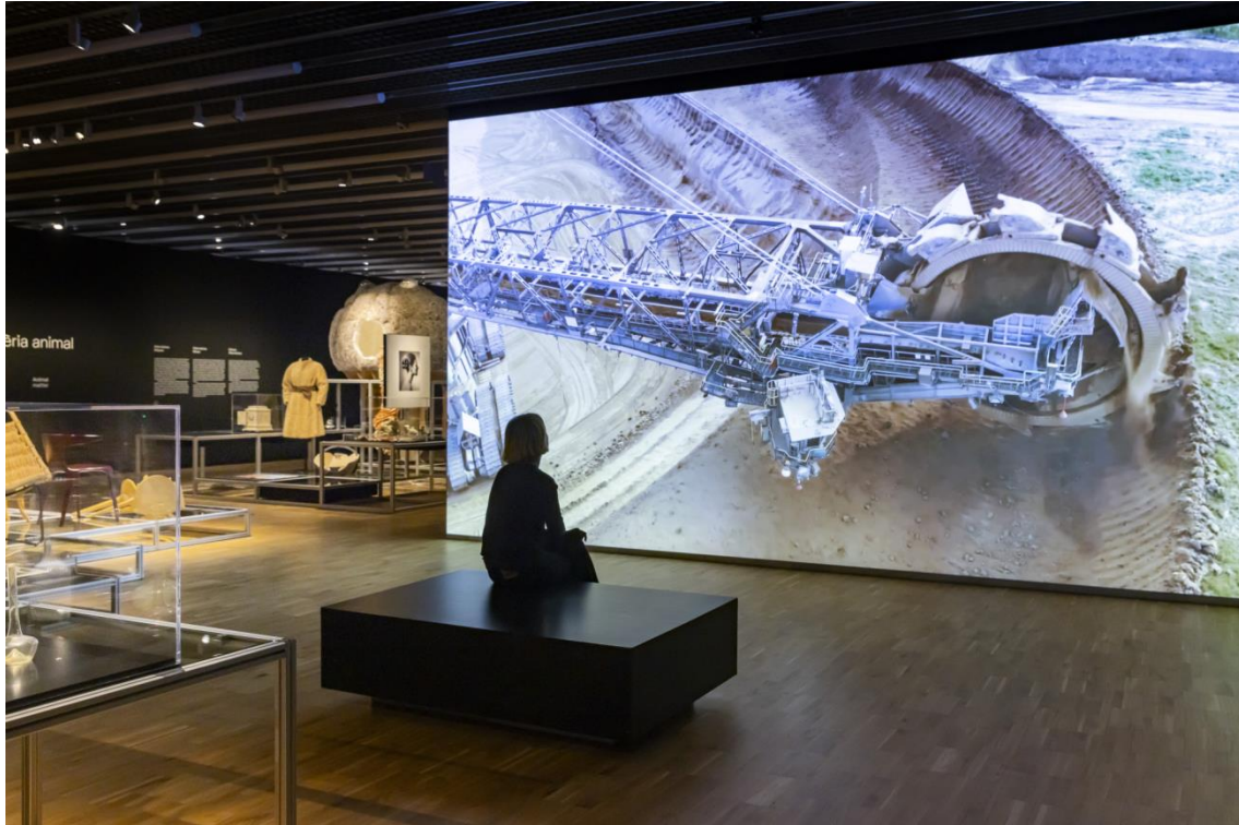
Slow Violence