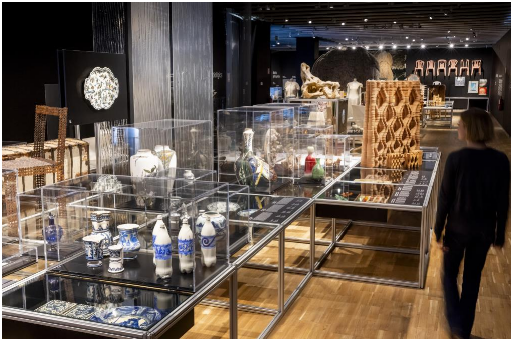
Matèria mineral