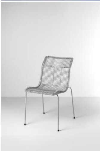
Silla DOING 1998 Niall O'Flynn Donación: Grupo T Diffusion, 2006. MADB 138.409