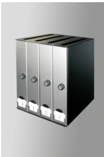
Buzón TRES, CUATRO, CINCO 1984 Lluís Clotet Òscar Tusquets Donación: BD, Ediciones de Diseño, 1995. MADB 135.853 (edición de 1993)