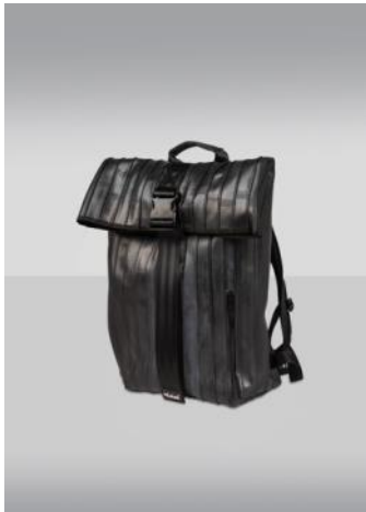
Mochila ARCE 2016 Donación: Nukak, 2021. MDB

Se pueden ver diseños ecoeficientes y de bajo impacto ambiental; diseños que promueven actitudes positivas y responsables por parte de los consumidores en lo que se refiere al uso de los artefactos y el entorno objetual.