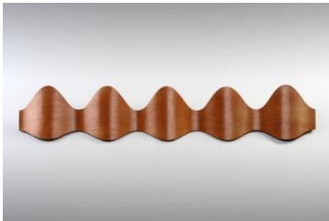
Perchero ONA c. 1990 Montse Padrós Carles Riart Donación: Mobles 114, 1994. MADB 135.477 (edición de 1992)

En los 80 se populariza el diseño, que recibe un nuevo impulso a través de empresas productoras y editoras. En realidad, el fenómeno de las editoras se remonta a una década atrás, pero en estos años se convierte en hecho característico del diseño barcelonés. La apuesta por el diseño también se pone de manifiesto en viejas y nuevas empresas del sector del equipamiento doméstico y urbano que contribuyen a dibujar una nueva cultura productiva vinculada al diseño. Este ámbito lee el fenómeno desde la perspectiva del vínculo entre diseñadores y empresas con especial atención a los procesos de diseño, producción y distribución.