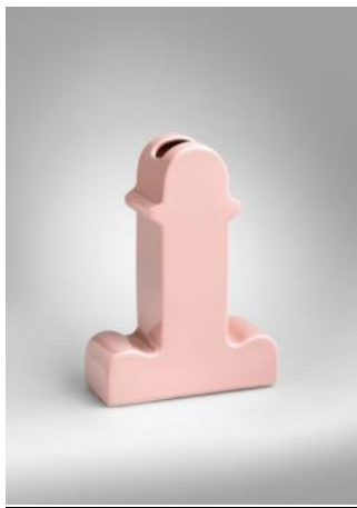
Jarrón SHIVA, 2021 Ettore Sottsass Donación BD Barcelona Design, 2021 MDB 14.048 (edición de 2021)

La primera exposición variable que puede verse es 'International Icons. Los diseños más internacionales'. Se trata de una selección de piezas que, desde los años 40 y hasta la actualidad, han trascendido más allá del ámbito local y se han convertido en referentes en la historia global del diseño. Las piezas seleccionadas se muestran junto a documentos - revistas, fotos, catálogos- que atestiguan su repercusión internacional.