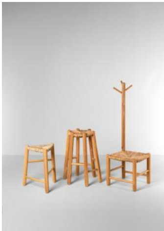
Asientos ON LA MEMORIA SOLIA ASSEURE'S 2007 Guillem Ferran Masip Donación: Guillem Ferran, 2021. MDB 14.031, MDB 14.030, MDB 14.027