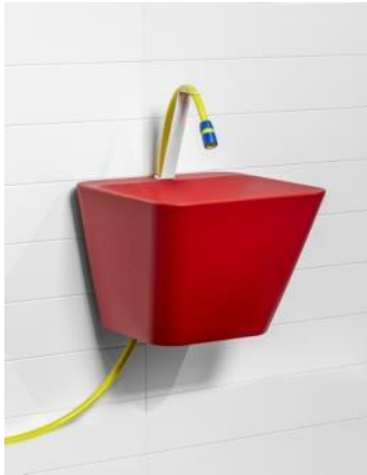
Fregadero SIMPLEX 2005 azúamoliné Donación: Industrias Cosmic, 2006. MADB 138.546