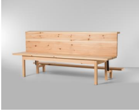
Banco cama ¡POR EL AMOR DE DIOS! 2010 Curro Claret Adquisició: Museu del Disseny de Barcelona, 2019. MDB 4.066 (edició de 2015)