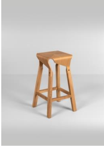
Taburete NAOSHIMA 2016 Ana Mir i Emili Padrós / Emiliana Design Studio Donación: Vergés, 2021. MDB

La actualidad del diseño es el de una escena global con destacados nombres españoles presentes en Milán o Londres. Pero también es el de una pluralidad de lenguajes y diseminación de alternativas.