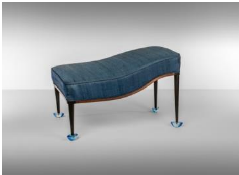
Banqueta 1992 Carles Riart Donación: Leopoldo Rodés Castañé, 2003. MADB 136.915

La pluralidad de opciones del diseño característica de los años 90 quedó registrada en Barcelona en las Primaveras del Diseño y en el ciclo de exposiciones culturales de la década. Esta proyección interna y externa afianza la capacidad del diseño de la capital catalana en representación del Estado y a nivel internacional.