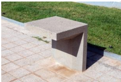
Lámpara Mota, 2007 Diseñada por: Aldayjover, arquitectura y paisaje Localización: Plaza de Josep Antoni Coderch