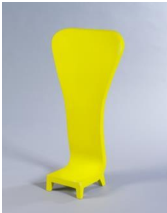
Silla H2O CHAIR 1999 Martí Guixé Donación: Galeria H2O, 2006. MADB 138.537