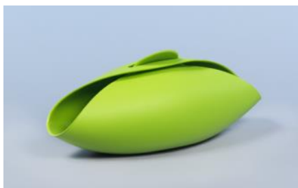
Bol 2011 Compeixalaigua Desingstudio Donación: Lékué, SL, 2011. MADB 138.814

En este ámbito, se muestran diseños de nuevos materiales y diseños que suponen una aplicación innovadora de materiales conocidos.