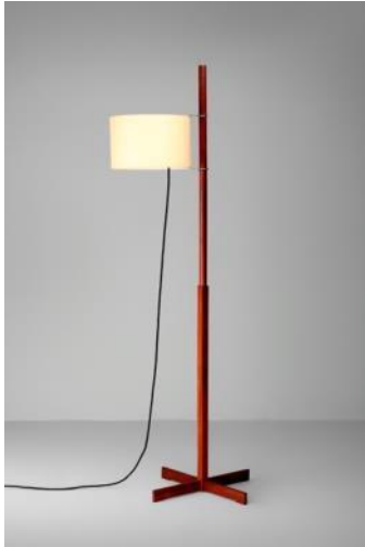
Lámpara de pie TMM 1962 Miguel Milá Donación: Santa & Cole, Ediciones de Diseño, SA, 1994. MADB 135.483 (edición de c. 1988)

La creación del SEDI en 1957 y de ADI en 1960, así como de los Premios Delta (1961) marca el inicio de la vida asociativa del diseño industrial y de las acciones para darlo a conocer. Esto se representa con documentos y revistas y con una selección de piezas galardonadas con los premios Delta que se han convertido en iconos del diseño catalán y español.