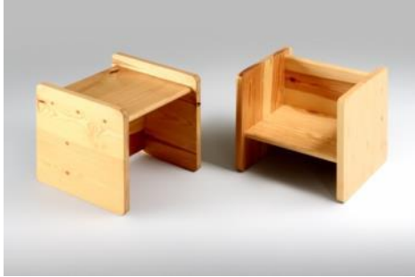
Taburete DELTA 1964 Jordi Vilanova i Bosch MADB 135.660