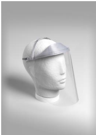
Pantalla facial COVIDMAKERS 2020 Donació: Morillas Brand Design, 2020. MDB 13.704