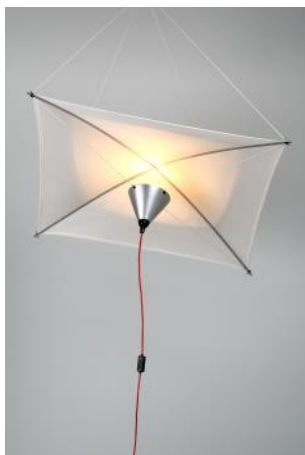
Lámpara para colgar / Hanging lamp COMETA, 1975 Charles Dillon - Jane Dillon Donación Diseño y Forma, SA (Disform), 1994; MADB 135.542 (edición de 1990)