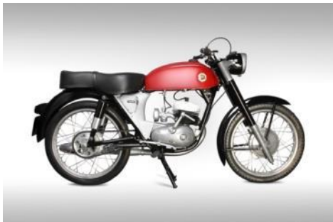
Motocicleta IMPALA 1962 Leopoldo Milá Sagnier Adquisición, 2009. MADB 138.697

La motocicleta Impala se muestra como objeto emblemático de un contexto, el de los 60, caracterizado por la producción seriada. El ambiente se completa con otros diseños asociados a procesos industriales (una estantería aglutina varios bienes de consumo domésticos y electrodomésticos) y unas imágenes del NO-DO sobre la producción seriada del Seat 600.