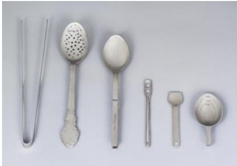
Cuartería EL BULLI COLLECTION, FACES FERRAN ADRIÀ 2004 Donación: Desing Mix Collection, 2006. MADB 138.433-138.438