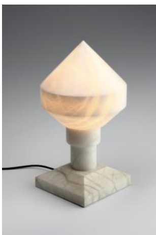
Lámpara de mesa ZELESTE 1973 Àngel Jové Santiago Roqueta Matías Donación: Santa & Cole, Ediciones de Diseño, SA, 1994. MADB 135.656 (edición de 1992)