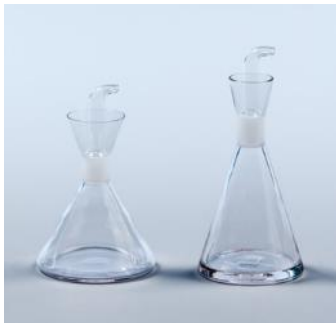
Aceiteras c. 1961 Rafael Marquina Donación: Nanimarquina-Diseño y Promoción, 1994. MADB 135.612