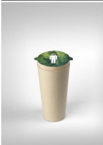
Recipiente funerario BIOS 2000 Gerard Moliné Donación: Centre d'Iniciatives per a la Reinserció, 2006. MADB 138.53