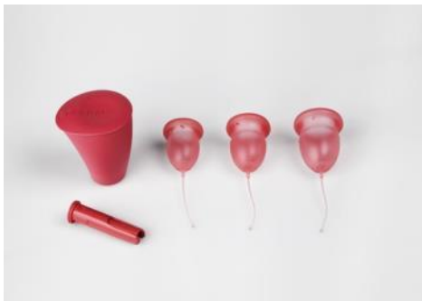
Copa menstrual ENNA CYCLE 2016 Ernest Perera Donación: EcareYou Innovation SL mediante ADI-FAD, 2019. MDB 8.990

Diseños que resultan de una aplicación intensiva de conocimiento experto y de innovaciones tecnológicas en diferentes sectores y campos profesionales.