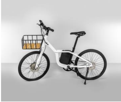
Bicicleta CARMELA24 2018 Donación: oh!bike factoria SL mediante ADI-FAD, 2019. MDB 8.987