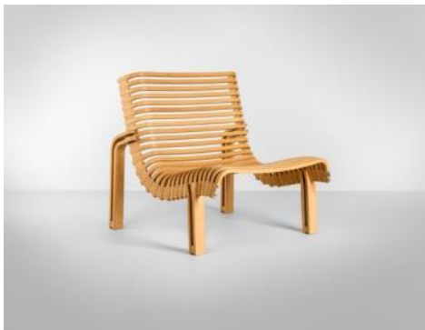
Butaca 1961 Equipo 57 Producción: Darro, Madrid, 1961-?;