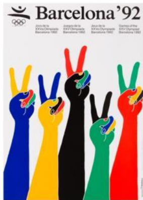
Cartel BARCELONA 92 1990 Enric Satué. MDB 1.742