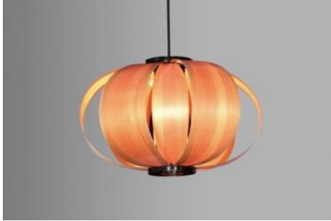
Lámpara de suspensión 1957 José Antonio Coderch de Sentmenat Compra: 1997. MADB 136.073 (edición de 1996)