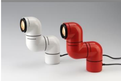
Lámpara de mesa y de pared TATÚ 1971 André Ricard Sala Donación: 1996. MADB 136.009, MADB 136.611