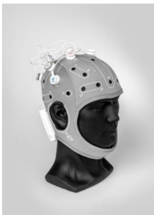
Casco de monitorización ENOBIO 2017 Anima Design, SL Donación: NEUROELECTRICS Barcelona, SL, 2021. MDB 14.046