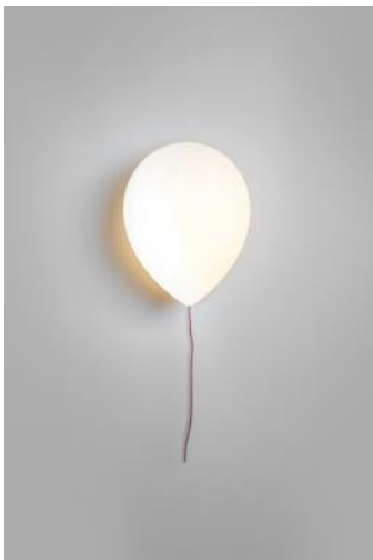
Lámpara de pared BALLOON 2012 Crouscalogero Donación: Estiluz, 2013. MADB 138.863