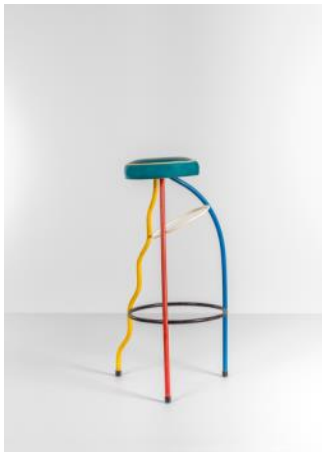
Taburete DÚPLEX 1980 Lluís Clotet Javier Mariscal Donación: 2018. MDB 2.680

La base de consumidores del diseño se amplía y éste se convierte en elemento de modernización de la sociedad española. Vinçon se convierte en referencia barcelonesa del diseño. Por eso, la empresa es protagonista de la escena. Son también los años del “diseño de autor” y de las referencias internacionales que se dan a conocer en revistas, exposiciones y ferias. Todo ello se expresa mediante un significativo repertorio de diseños de sillas, el objeto que representa la relevancia del diseño doméstico en esta época.