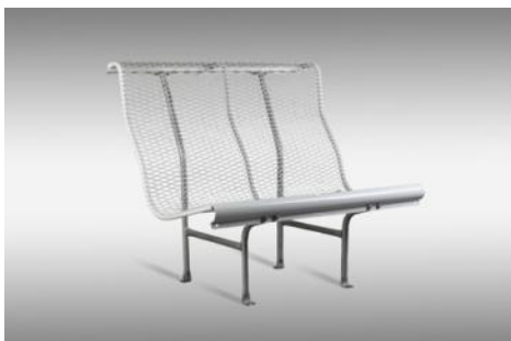
Banco CATALANO 1974 Lluís Clotet Ballús Òscar Tusquets Donación: BD, Ediciones de Diseño, 1995. MADB 135.861 (edición de 1994)