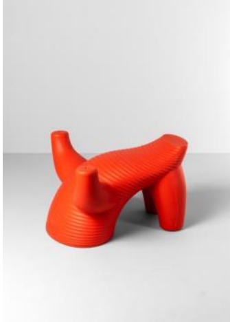
Asiento MICO 2005 El Último Grito Donación: Magis Spa, 2006. MADB 138.547