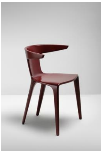
ROTHKO 1989 Alberto Lievore Donación: Indartu (Simeyco), 1995. MADB 135.898 (edición de 1994)