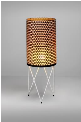
Lámpara de pie PEDRERA c. 1955 Francisco Juan Barba Corsini MADB 135.429