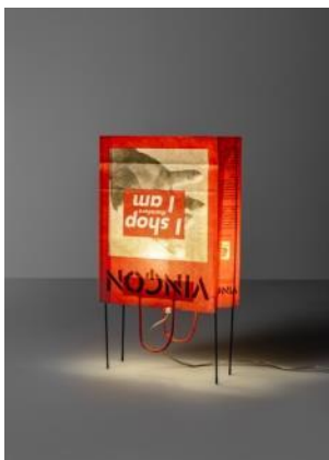
Lámpara de mesa BOLSA 1996 Víctor Juan Arrufat Bossa de Barbara Kruger, 1995 Donación: Família Amat, 2018. MDB 2.512