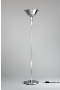
Lámpara de pie. GATCPAC c. 1932 Donación: Santa & Cole, Ediciones de Diseño, SA, 1999. MADB 136.584