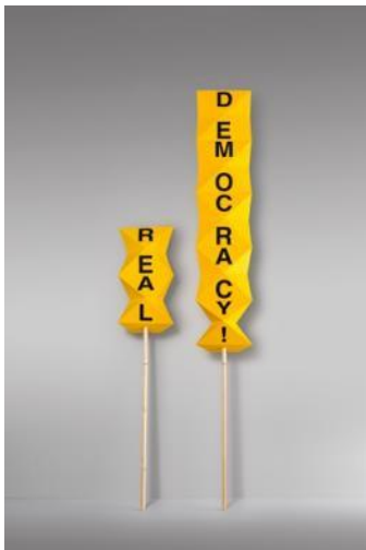
Pancarta 2012 Máster de Diseño de Producto de la UCH-CEU, dirigido por Héctor Serrano Donación: Héctor Serrano, 2021. MDB (edición de 2021)

Se trata de diseños que van más allá de los circuitos de fabricación, comercialización y consumo de un producto convencional y que conllevan una propuesta de la ejecución de acciones distintas a las habituales. Así, la implicación de los participantes define la forma y prestaciones de la propuesta conceptual.