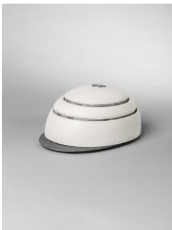
Casco CLOSCA HELMET 2016 Donación: Closca Design, 2019. MDB 7.044-7.045

Pueden verse diseños que facilitan el acceso a experiencias diferentes respecto al entorno intensificando los sentidos del olfato, la vista y el tacto o que aumentan nuestra percepción y conciencia sensible sobre las actividades ordinarias.