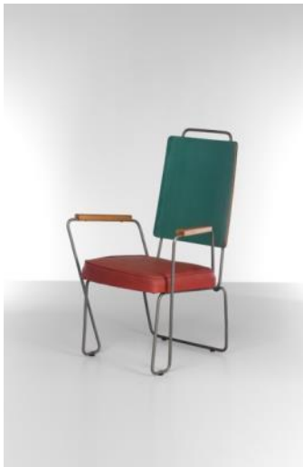
Butaca 1954 Antoni de Moragas i Gallissà Donación: familia de Moragas-Spà, 2014. MADB 138.910

La serie de sillas de Moragas para el Concurso Pro Dignificación de la Hogar Popular del año 54 ejemplifican el espíritu de recuperación de la modernidad de los pioneros del diseño de los años 50. Estas, junto con otras piezas, evidencian la preocupación por la vivienda y su equipamiento en ese momento histórico.