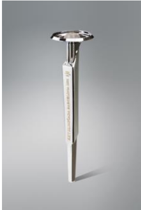
Antorcha olímpica BARCELONA'92 1992 André Ricard Sala Donación: Vilagrassa, SA, 1995. MADB 135.880

La celebración de los JJOO de BCN'92 comporta una intensa movilización cultural que implica al diseño urbano y, en general, a la imagen de Barcelona. La ciudad queda asociada al diseño. El proceso se escenifica en este ámbito mediante objetos directamente relacionado con los JJOO o con el equipamiento urbano del período.