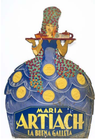
Artiach La buena galleta c. 1930 Expositor de pie Gráficas Laborde y Labayen - Tolosa Colección Mateu Linàs i Audet