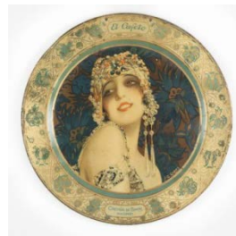
El Cafeto Crótido de Simón c. 1920 Gaspar Camps G. de Andreis. M. E. Badalona Colección Mateu Linàs i Audet