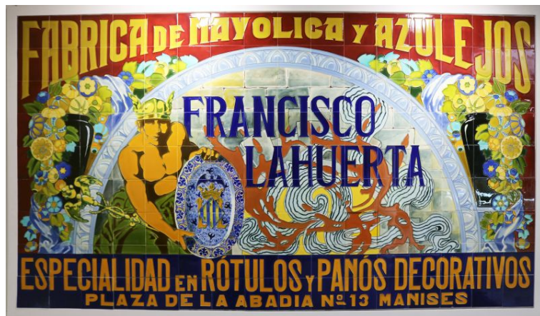
Fábrica de azulejos Francisco Lahuerta Mural de azulejo cerámico c. 1927 Museu de Manises