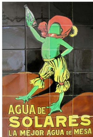
Agua de Solares Plafón de azulejos 1925-1936 Museu de Manises