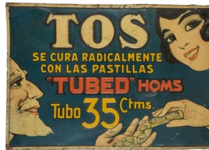
"Tubed" Homs TOS se cura radicalmente con las pastillas c. 1925 G. de Andreis. M. E. Badalona Colección Mateu Llinàs i Audet