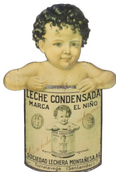
El niño. Leche condensada Con toda su crema c. 1920 Ind. Metalgráfica Tintoré y Oller. Barcelona Colección Mateu Linàs i Audet