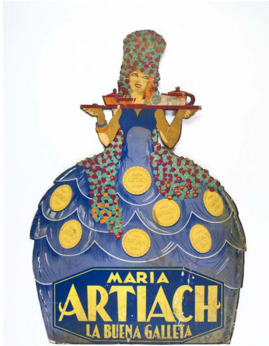
Artiach. La buena galleta c. 1930. Colección Mateu Llinàs i Audet

“El boom de la publicidad. Reclamos de hojalata, cartón y azulejo. 1890-1950” en el Museu del Disseny a partir de diciembre